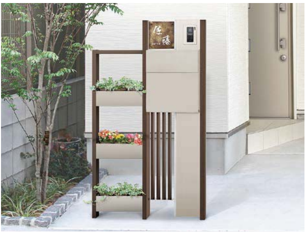
グリーンスタンド ファンクションユニット仕様 ※植木鉢は別途手配してください。