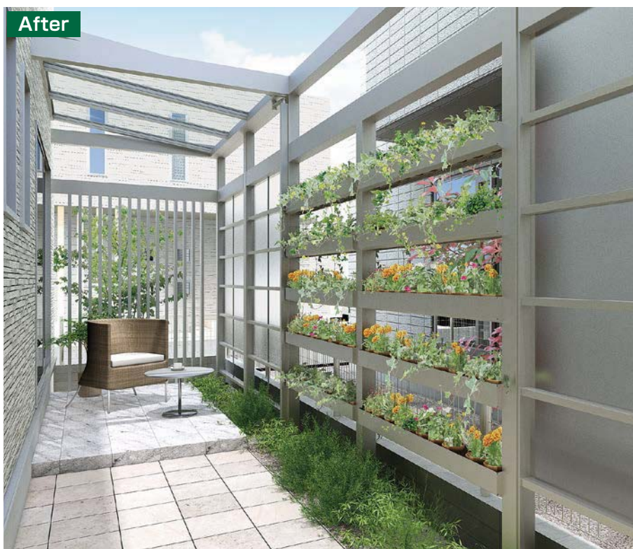
シャイングレー W15 H15 ※植木鉢は別途手配してください。