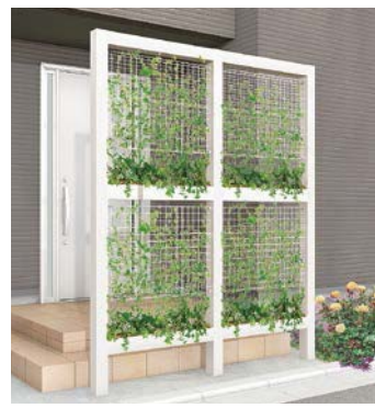
エコリス グリーンメッシュ ※植木鉢は別途手配してください。