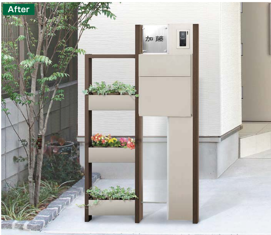
ファンクションユニット仕様 シャイングレー+クリエダーク(ウィルモダン使用) W04H11 ※植木鉢は別途手配してください。