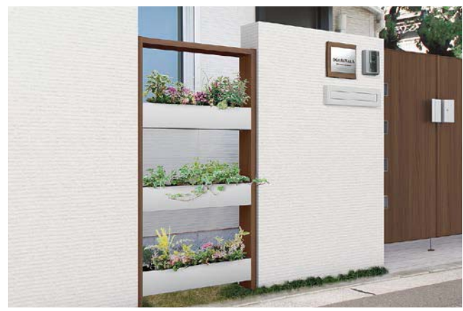
グリーンスタンド 独立仕様 ※植木鉢は別途手配してください。