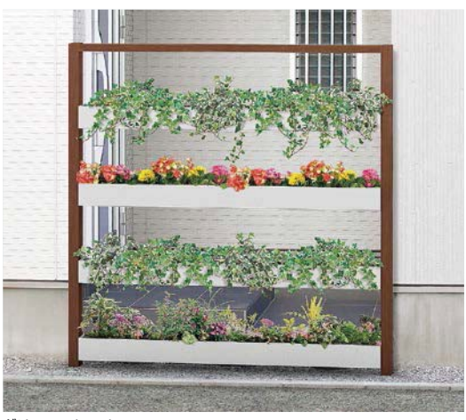
グリーンフレーム ※植木鉢は別途手配してください。