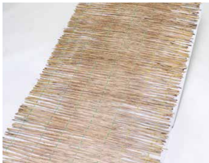
※写真はロンケット ワラです。